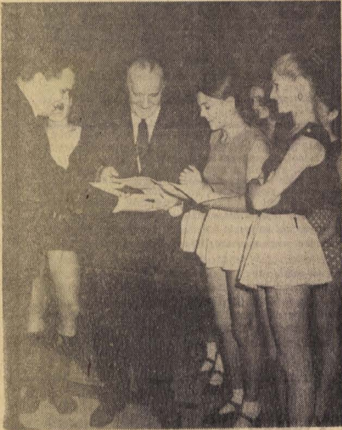
A Babits Mihály művelődési központ néptáncosai között.