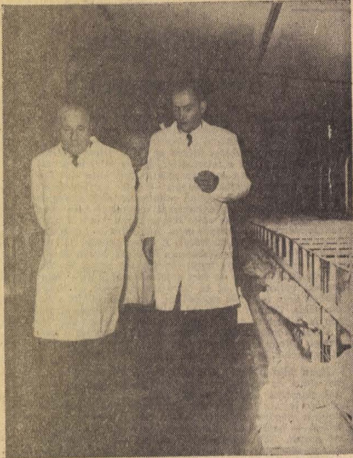
A Szekszárdi Állami Gazdaság sertéstelepén.